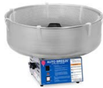
MACCHINA AUTO BREEZE