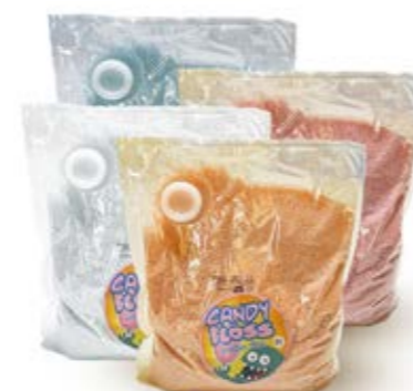
BIANCO (SU ORDINAZIONE)