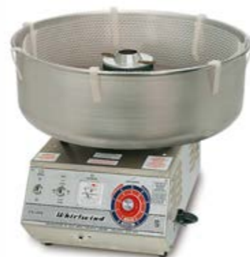
MACCHINA WHIRLWIND (SOLO SU ORDINAZIONE)