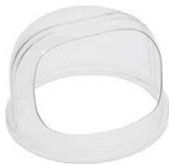
CUPOLA IN PLEXIGLASS SINGOLA