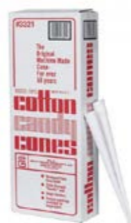
CONI IN CARTA PER ZUCCHERO FILATO