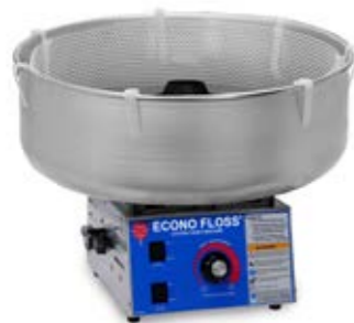
MACCHINA ECONO FLOSS (SOLO SU ORDINAZIONE)