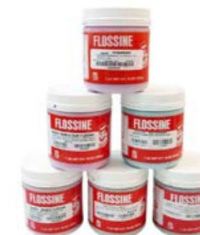
FLOSSINE IN VARI GUSTI

Concentrato aromatizzato e colorato per zucchero comune.